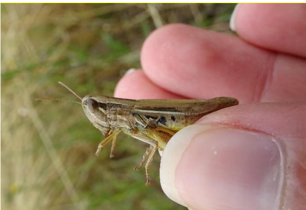
Criquet des Bromes ( Euchorthippus declivus )