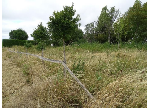
Site d'étude : Verger enfriché