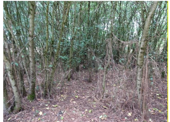
Site d'étude : Boisement