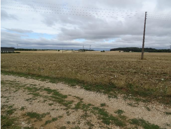
Site d'étude : parcelle cultivée